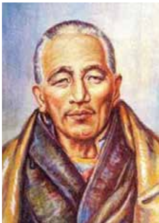
Meester Djwhal Khul

Een van de andere genoemde Meesters is de al genoemde Djwhal Khul (DK). Die was in de jaren dat Alice Bailey leefde geïncarneerd als Tibetaanse monnik en leidde een klooster. Daarom wordt hij ook wel 'de Tibetaan' genoemd. Hij heeft de grootste kennis van de Tijdloze Wijsheid van alle Meesters en het is zijn taak om deze kennis over te dragen aan de mensheid. Daarvoor heeft hij onder andere Alice Bailey gebruikt, en daaraan voorafgaand Helena Blavatsky. Deze overdracht ging via mentale telepathie en voor zover bekend heeft hij Alice Bailey nooit in het fysieke veld ontmoet.