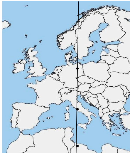
Afbeelding 2: De 12° lengtelijn die exact door Berlijn, Rome en Tripoli (de drie stippen) loopt.

Calleman betoogt dat er behoorlijk veel concrete gebeurtenissen zijn geweest op en rond 28 oktober 2011, die de door hem voorspelde instorting van de op dualiteit gebaseerde beschaving (in feite het einde van dominante autoriteit) en de overgang naar eenheidsbewustzijn bevestigen. Hiervoor dienen we vooral te kijken naar wat er is gebeurd in de landen op de 12 graden Oosterlengtelijn (zie afbeelding 2) van de aarde, omdat langs deze lijn de dualiteit het eerst is gevestigd in de zesde onderwereld (de Lange Telling die 5125 jaar geleden is begonnen). Daarom zullen de eerste effecten van de overstijging (ascensie!) van de dualiteit te zien zijn langs deze lijn en zich van daaruit verder verspreiden naar het Oosten en Westen. Dit is een essentieel punt om te begrijpen! , schrijft Calleman. 1