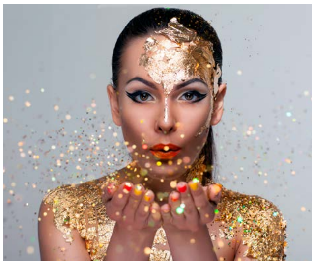
Afbeelding 4: Glamour oftewel begoocheling