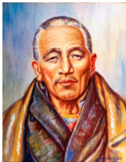
Afbeelding 3: Meester Djwhal Khul

Deze bundeling van macht kunnen we het moderne fascisme noemen. Dit woord komt van het Italiaanse 'fascio', hetgeen 'bundel' betekent. Deze machtsconcentratie is alles doordringend en wordt verhuld achter zalvende, holle woorden en een glimlach. Personages als Von der Leyen, Schwab, Gates, Trudeau, Macron en Rutte zijn hier goede voorbeelden van. En als klap op de vuurpijl worden degenen die hierop wijzen juist als 'fascistisch' of 'extreem-