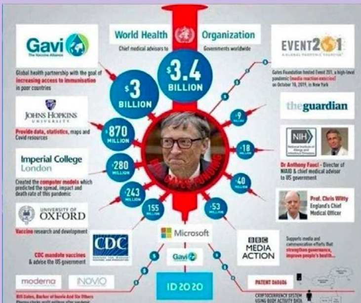
Afbeelding 1: Bill Gates, de spin in het web

‘Was het coronagebeuren niet een ware kwelling voor ons allen?’