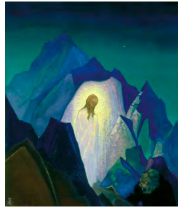
Schilderij: Nicolas Roerich

Maar wat betekent dit? Nou, onder andere dat er eindelijk serieus werk zal worden gemaakt van het installeren van juiste menselijke relaties en van juiste relaties met de andere natuurrijken (mineralen, planten, dieren en de aarde zelf). Dit houdt onder meer in dat er gewerkt zal gaan worden aan een eerlijke verdeling van de overvloed die