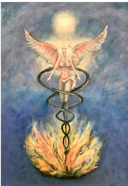
Schilderij: Eric Huysmans

‘De verschijning van de Hiërarchie beperkt zich nog tot de mentale niveaus, maar wanneer de gedachtevorm van de exoterische aanwezigheid van de Hiërarchie door de mensheid zelf is gecreëerd en haar invocatieve schreeuw intens genoeg is, zal deze verschijnen in het fysieke veld .’