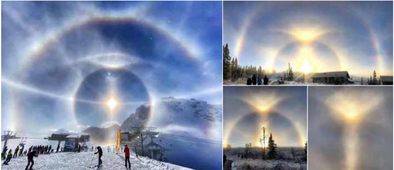
Afbeelding 1: Weerkaatsing van de zon die een corona vormt met prachtige cirkels daar om- en doorheen, en een soort schotel (links) of kroon (rechts) op de top van de eerste cirkel (namen fotografen zijn onbekend).

Ik vond deze foto's zo mooi en treffend voor wat er plaatsvond, dat ik er een schilderij van heb gemaakt (afbeelding 2). Ik zag ook een engel in de foto's, die heb ik wat explicieter gemaakt. Schilderen is sinds 2019 een hobby en dit is pas mijn tweede, nog wat rudimentaire, schilderij. Toch vind ik het de moeite waard om hier te tonen. Ik heb het, uiteraard, de titel Coronation gegeven.