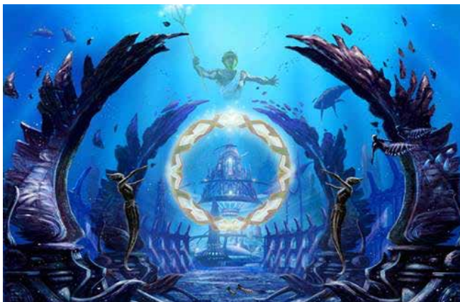
Foto: Strijd tussen de krachten van Licht en Duisternis.

Klinkt dit alles niet bekend in de oren? Is dit niet in grote mate vergelijkbaar met onze huidige periode? Is het dan gek dat de periode 2020-2025 vergeleken wordt met die van 1940-1945? Een vergelijking die de mainstream media en de gevestigde politiek zo heftig bestrijden. Deze vergelijking zou “schandalig” zijn en “disrespectvol ten aanzien van de oorlogsslachtoffers”. Ik zou het tegendeel willen beweren. Het is juist een uiting van groot respect voor alle slachtoffers wanneer we zien en erkennen dat we, in de woorden van DK, in “een nieuw punt van wereldspanning” zitten en dat we van onze fouten uit het verleden leren en het dit keer anders doen. Het lijkt toch vrij duidelijk dat we ons nu, op een hoger niveau van de spiraal, in dezelfde energieën bevinden als toen.